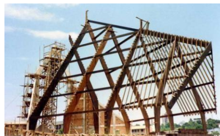
Figura 1 - Armação da Igreja Nossa Senhora de Guadalupe, Cuiabá - Mato Grosso

As figuras deverão ser centralizadas na coluna (caixa de texto), podem ser coloridas, e o tamanho da fonte, em seu interior, título, ou indicação de fonte, serão de 28 pts.